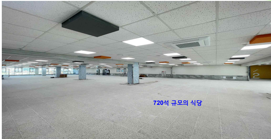
720석 규모의 식당